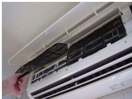
～エアコン内部フィルター清掃イメージ～